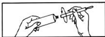
Aplicador do creme (bisnaga).

Lave bem as mãos antes e depois das aplicações com Ginna (nitrato de fenticonazol).