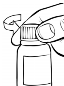
Figura 1: Coloque o frasco na posição vertical com a tampa para o lado de cima, gire-a até romper o lacre.

As gotas deverão ser dissolvidas em quantidade suficiente de água filtrada